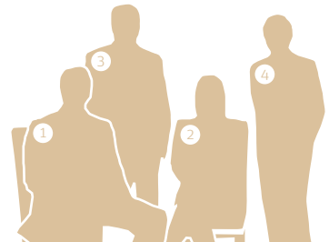
Şerif Orhan Çolak (4) Yönetim Kurulu Üyesi